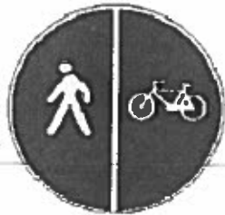
Figura II.92/a, nen 120

RRUGEKALIMI PËR BIÇIKLETA, NGJITUR ME TROTUARIN Tregon fillimin ose vazhdimin e një piste ose korsie, të rezervuar për biçikleta, ngjitur ose paralel me një trotuar ose edhe me një kalim të rezervuar për këmbeasore. Simbolet mund të jenë të anasjelltë, për të treguar pozicionin real të pistës e të trotuarit.