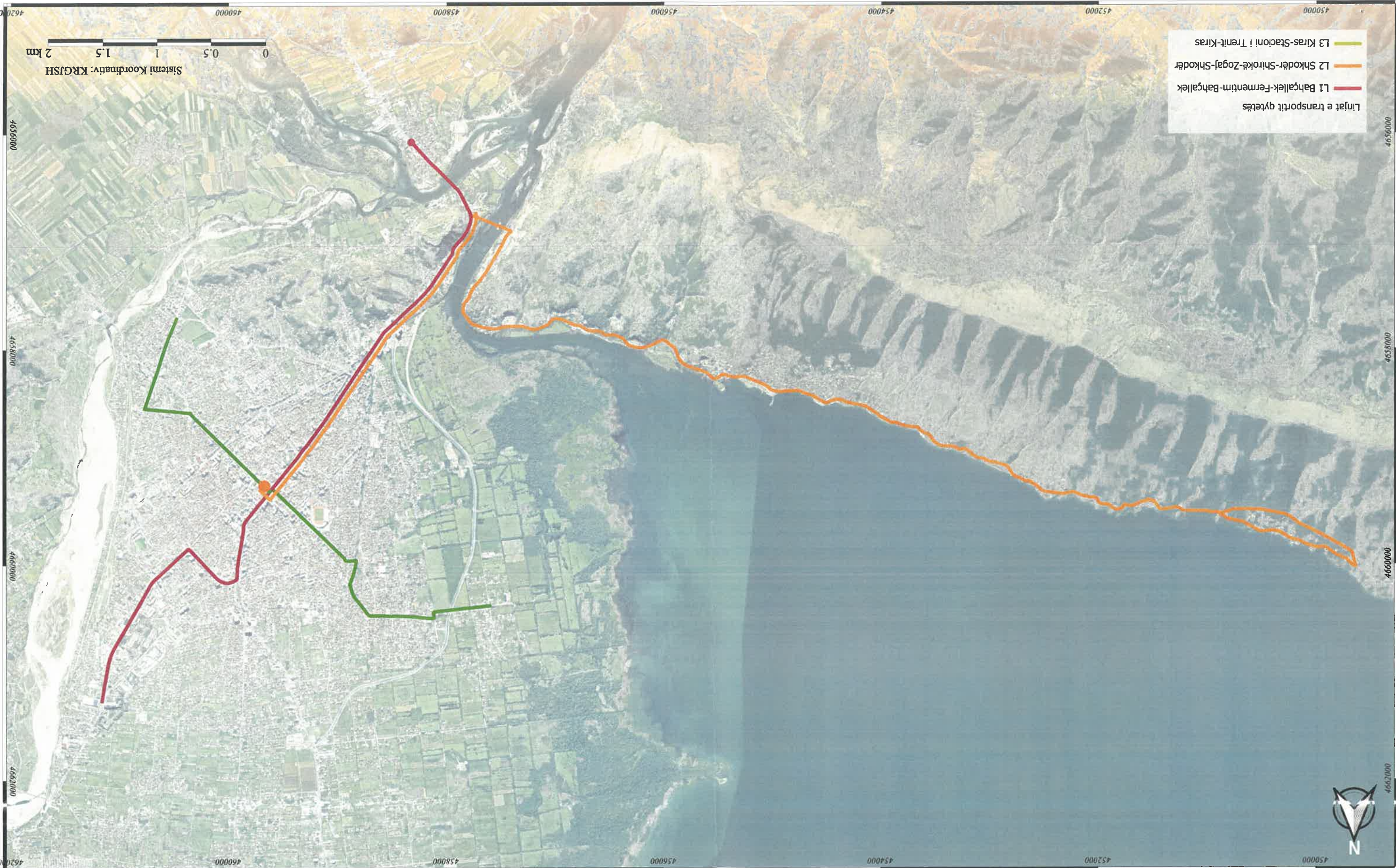
HARTA E LINJAVE QYTETËSE TE TRANSPORTIT TË UDHËTARËVE

Sistemi Koordinativ: KRGJSH 0 0.5 1 1.5 2 km