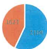
Nr. i fëmijëve 3-6 vjeç

Kjo panoramë nënvizon nevojën për ndërhyrje të mirëorientuara që synojnë jo vetëm zgjerimin e kapaciteteve ekzistuese, por edhe rritjen e ndërgjegjësimit komunitar për rëndësinë e edukimit të hershëm. Përmirësimi i infrastrukturës, garantimi i aksesit të barabartë dhe zbatimi i masave mbështetëse për familjet në nevojë janë çelës për të siguruar një edukim gjithëpërfshirës dhe cilësor për të gjithë fëmijët e moshës 3–6 vjeç në territorin e Bashkisë Shkodër.