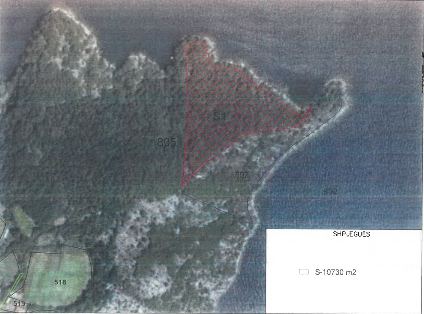
SH 1 :2500

X = 467911.041 Y = 4658548.380 KORNIZA REFERUESE GJEODEZIKE SHQIPTARE X = 468405.515 Y = 4658548.380