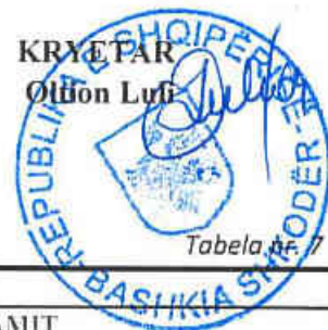
Tabela Nr. 7