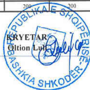
Tabela nr. 6