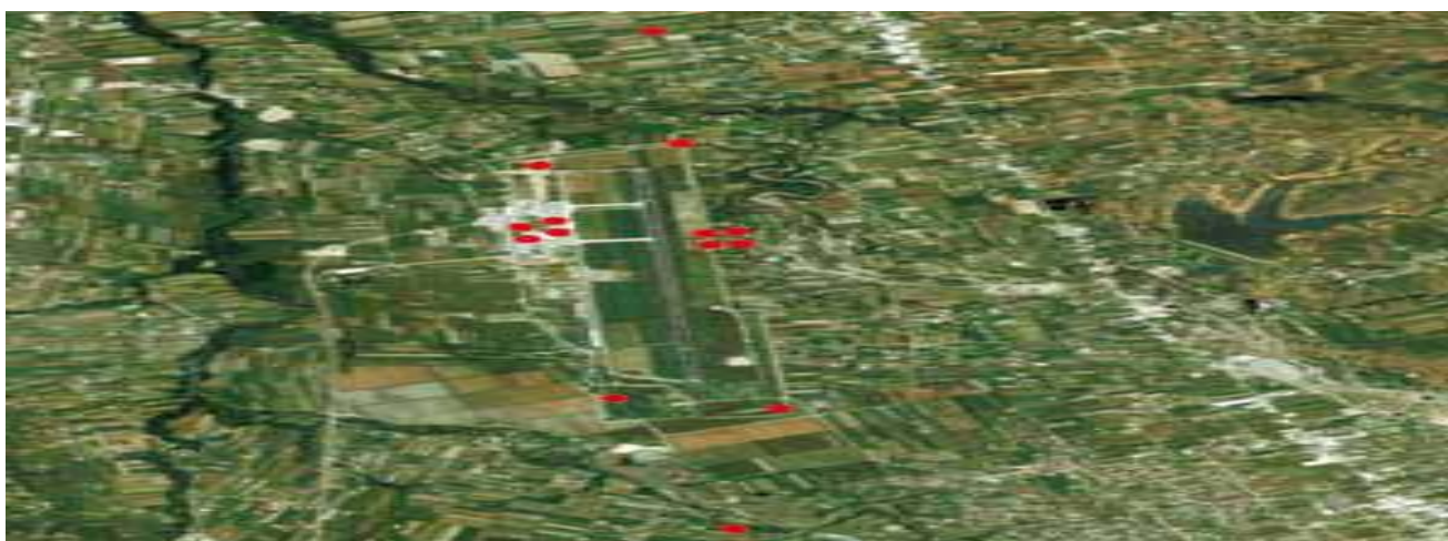
Figura nr.2 Pozicionet e monitorimit të zhurmave në aeroportin “Nënë Tereza”

Monitorimi i zhurmave kryhet mbi bazën e pozicioneve të konsideruara si më përfaqësuese dhe më strategjike brenda dhe jashtë zonës së aeroportit gjatë sezonit të pikut, si dhe jashtë tij. Matjet 24-orëshe u klasifikuan në tri periudha: orët e ditës 07:00-19:00, orët e mbrëmjes 19:00-23:00 dhe orët e natës 23:00-07:00 Matjet e zhurmave kryhen në përputhje me ligjin nr.9774, datë 12.7.2007 “Për vlerësimin dhe administrimin e zhurmës në mjedis” dhe me direktivën 2002/30/EC e Parlamentit European (PE) dhe Këshillit të BE-së të datës 26 mars 2002 për vendosjen e rregullave dhe procedurave në lidhje me përhapjen dhe kufizimin e zhurmave në aeroport. Gjatë këtij procesi u përdorën dy modele aparaturash për matjen e nivelit të zhurmave në pozicione specifike.