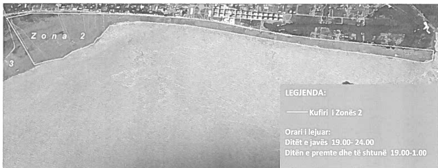
Harta 2. Zona 2: Strukturat e Stacioneve të Plazhit ( beach-bar) të cilat ndodhen në pjesën ranore përtej Shetitores këmbësore( pedonale)