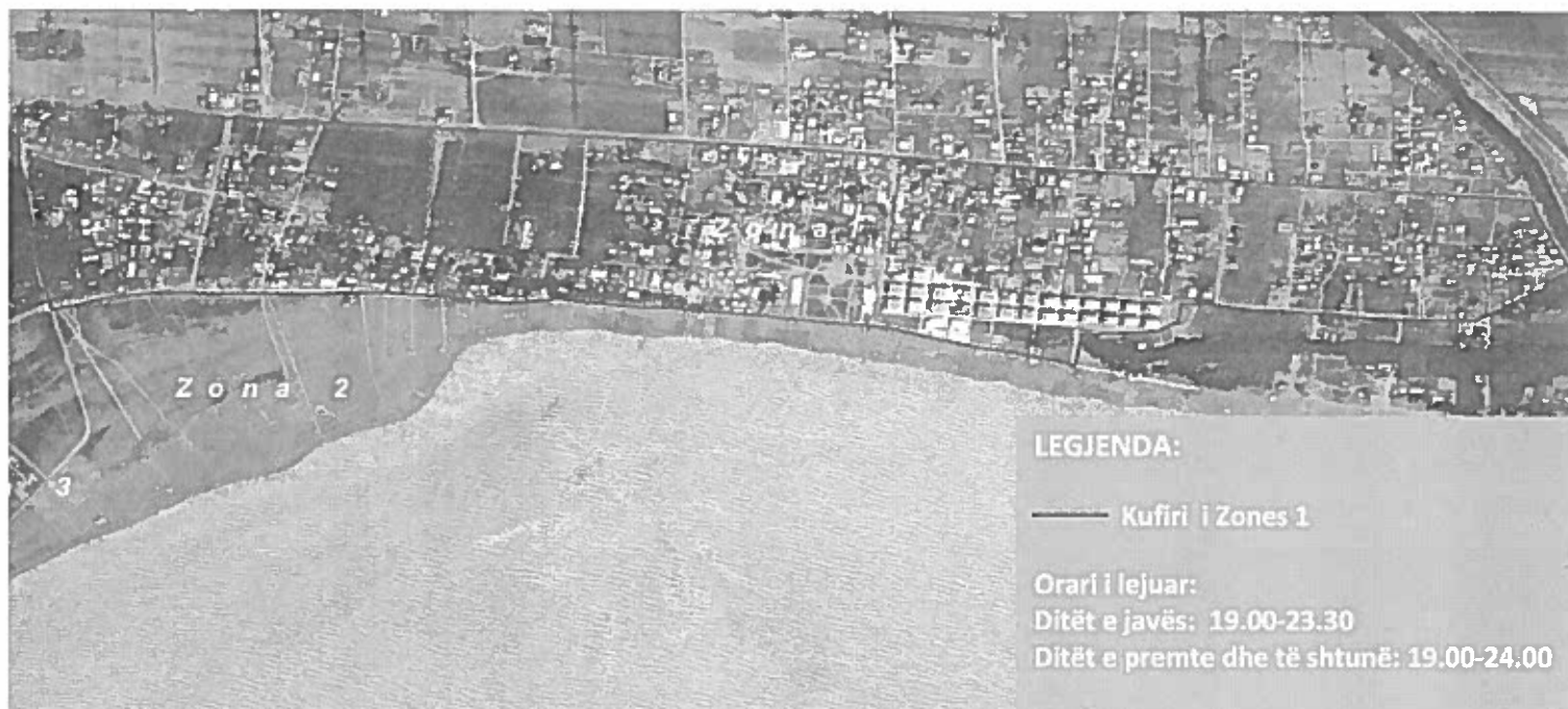
Harta 1. Zona 1: Zona urbane të Plazhit të Velipojës