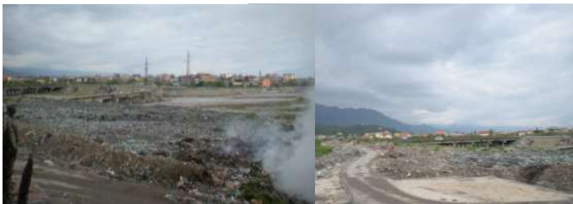
Pamje nga ish vend-depozitimi i mbetjeve urbane

Në fushën e mbetjeve here pas here vihet re edhe prezenca e tymrave që vjen nga djegia e mbeturinave (kryesisht nga vetë-djegia e brendshme e tyre si pasojë e proceseve kimike). Kjo situatë është mjaft shqetësuese dhe kërkon ndërhyrje të menjëhershme për përmirësimin e saj.